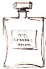
建築 川北 英