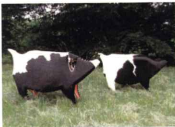
金属 ブース 市村