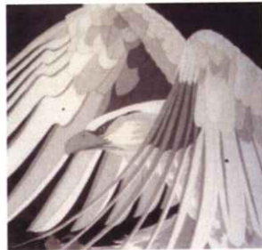
ブリスアート 浜崎 ペア

第7回シナジー展を開催 します。1917年竣工、 国重要文化財である横 浜市開港記念開館の ステンドグラスの修復を メンバーの一人が、横 浜開港150周年記念事業 として手掛けています。 今回はこの魅力ある建 物に各メンバーがそれ ぞれの素材を使い、空 間提案を試みることに なりました。