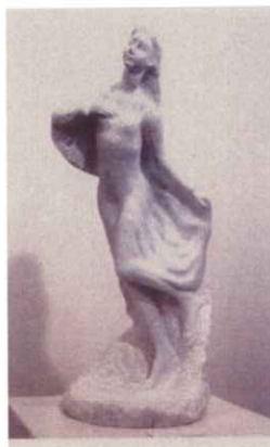
彫刻 三木 勝