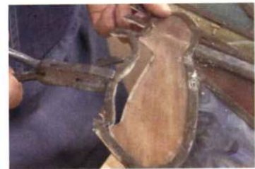
スタンドグラス 平山 健雄